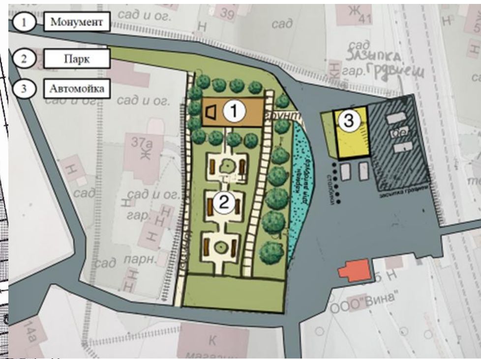
Дорожная карта - план мероприятий по продвижению Мемориального комплекса - Планировочное решение Администрации г.Одинцово

Дорожная карта, апрель 2015 года - план мероприятий по продвижению Мемориального комплекса - Планировочное решение Администрации г.Одинцово. Ул.Советская, рядом с ж/д платформой Ромашково. Обозначения: